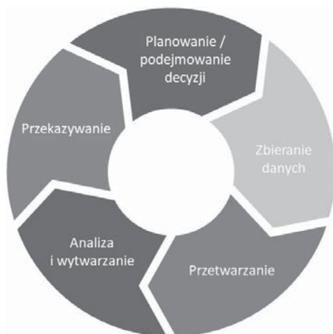
RYS. 21. Cykl wywiadowczy

Podstawę cyklu wywiadowczego stanowi jednak proces w formie pięcio-etapowej przedstawiony na rys. 21.